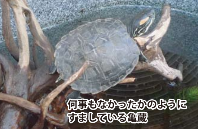
何事もなかったかのように すましていた亀蔵